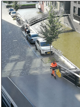
Foto's van het grachtenvuil in Holland Park. Meegezonden in de e-mail aan de Opzichter derden, Team Infra, Afdeling Ruimtelijk Beheer

In Diemen hebben we sinds kort een grachtengordel en zoals u weet ligt die in Holland Park. De mooie grachten worden helaas ook voorzien van afval, wat er weer uitgevist moet worden. De Onafhankelijke Partij Diemen heeft naar aanleiding van klachten van bewoners vragen gesteld aan de Opzichter derden, Team Infra, Afdeling Ruimtelijk Beheer (zie e-mail correspondentie op pag. 2). Uiteindelijk is de conclusie van de opzichter "Al met al een stevige aanpak die volgens mij ruimschoots voldoende zou moeten zijn, ik heb niet de indruk dat hier nog extra maatregelen nodig zijn". Helaas delen wij, de OnPD, deze mening niet. Bij de behandeling in de raad is er volgens ons nooit gesproken over de neveneffecten van de grachten in Diemen.